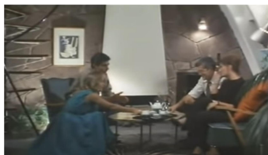
Fotograma de "Últimas tardes con Teresa", que mostra l'interior d'un dels apartaments de l'àtic de La Pedrera

revestida amb pedra, els arcs revocats de blanc i una llar de foc i una escala caragol que responen totalment a l'"estil americà" que l'arquitecte Barba Corsini va donar a aquests espais.