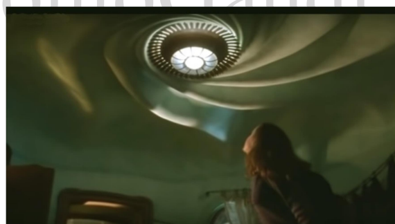
Fotograma de "Casper" amb la reproducció del cel-ras del saló de la Casa Batlló

En aquesta casa molts dels seus ambients reproduïxen literalment elements d'obres de Gaudí: Finestres i portes i el cielorraso espiral de la Casa Batlló, fusteria de la Pedrera i columnes inspirades al Palau Güell i la Casa Calvet, a més d'arcs parabòlics que recorden al Col·legi Teresià.