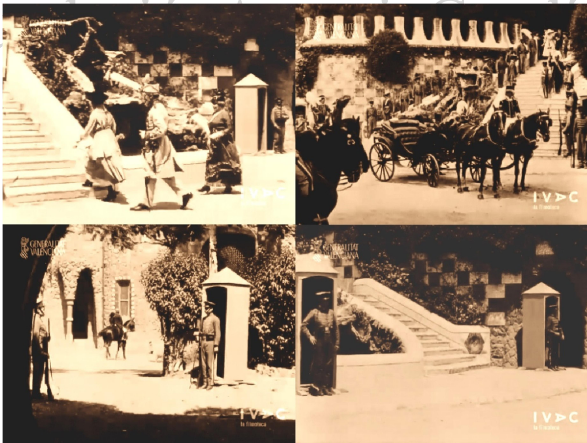
Fotogrames de "La Reina Joven", de Magín Muriá

Els viaductes són el jardí d'un Palau Reial que en l'argument de la pel·lícula seran cedits a la ciutat, com una premonició del que efectivament va passar amb l'emprenedoria de Güell anys després. Les cèlebres escalinates de l'entrada figuren l'entrada del palau. Per l'ambientació van ser agregades unes curioses garites de guàrdia. Hi ha també escenes en la columnata de la Sala Hipòstila.