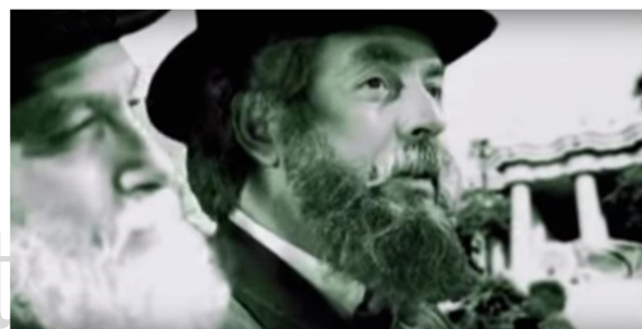
Fotograma de "Güell i Gaudí, un projecte comú", de Joan Riedweg

En el marc de les innumbrables manifestacions que van tenir lloc durant l'Any Gaudí 2002 (sesquicentenari del naixement de l'arquitecte), la Diputació de Barcelona va encarregar al director Joan Riedweg la realització d'un curtmetratge.