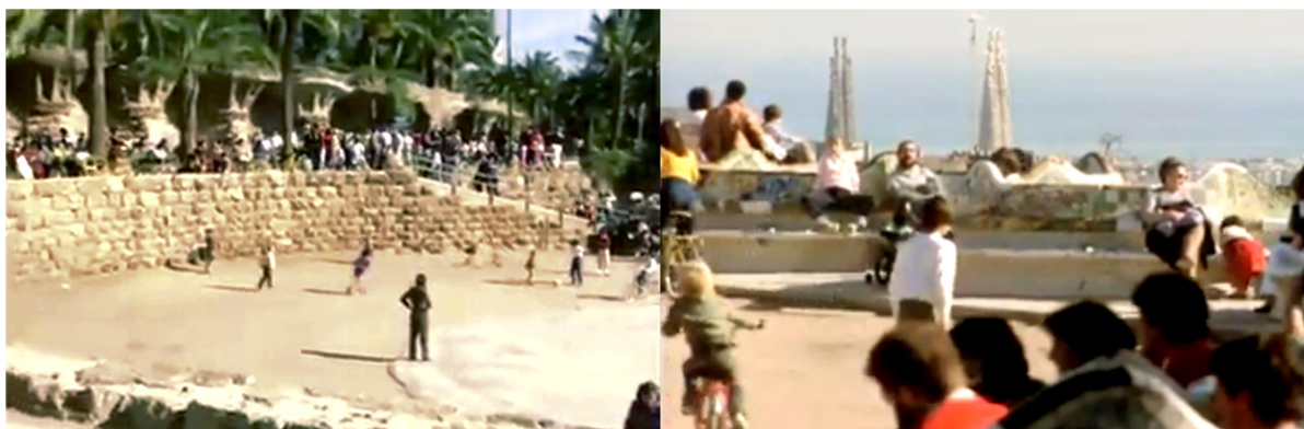
Fotogrames d'"Antoni Gaudí", de Hiroshi Teshigahara

Gairebé no n'hi ha canal o cadena de TV que no hagi produït algun, especialment a partir de la difusió mundial que va comportar l'Any Gaudí 2002. Estan a l'abast de tothom a través de la web i les xarxes socials pel que aquí simplement es convida a