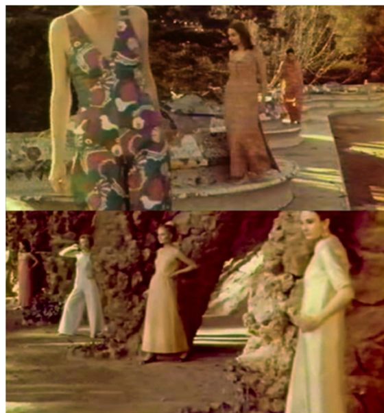
Fotogrames de "Cada Vez que...", de Carlos Durán

És remarcable el valor que van atorgar a l'obra de Gaudí els realitzadors enrolats en la "Escola de Barcelona", els qui es van identificar amb la seva expressió desenfadada i lliure de lligams i la van adoptar com a escenari de films que van intentar retratar l'esperit renovador i l'eclosió de creativitat que es vivia a Barcelona a la dècada de 1960 com a reflex del que passava a la resta del món. 6